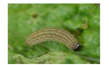
ハイマダラ/メイガ